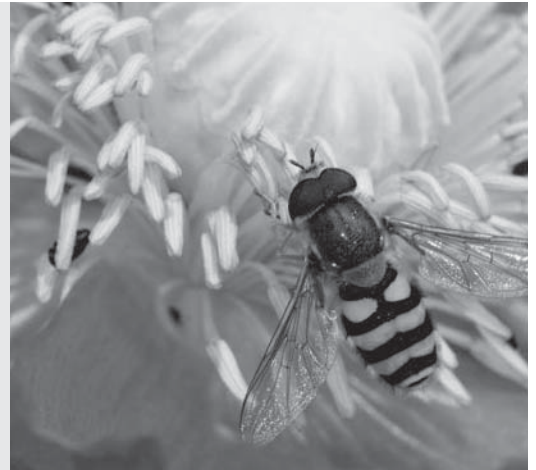
Deze zweefvlieg lijkt op een wesp, maar hij kan niet steken.

op een wesp. Vogels pakken geen wespen, maar ze zien niet het verschil tussen een zweefvlieg en een wesp. De zweefvlieg wordt dus beschermd, omdat hij op een ander dier lijkt. Dat heet mimicry . Dat is een vorm van camouflage. Sommige vlinders hebben vlekken op hun vleugels die op ogen lijken. Komt er een vogel aan, dan opent de vlinder zijn vleugels. Voor de aanvaller lijkt het of hij in het gezicht van een uil kijkt!