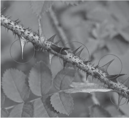
Stekels zijn vooral geschikt om grote planteneters af te schrikken.