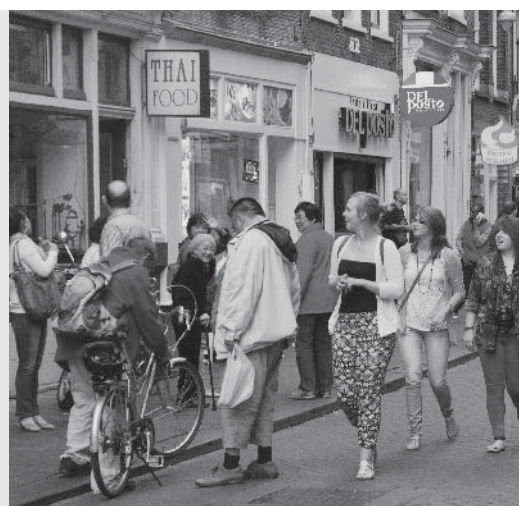
Overgenomen uit andere culturen.

noemen we Nederland wel een multiculturele samenleving . Sommige mensen hebben moeite om aan al die verschillende culturen te wennen. Ze vinden bijvoorbeeld hoofddoekjes maar 'raar'. Maar anderen vinden al die verschillen juist leuk. De samenleving is er kleurrijker door geworden, zeggen ze. Zo vieren ze nu Sinterklaas en Suikerfeest en eten ze niet alleen aardappels, maar ook pizza of shoarma.