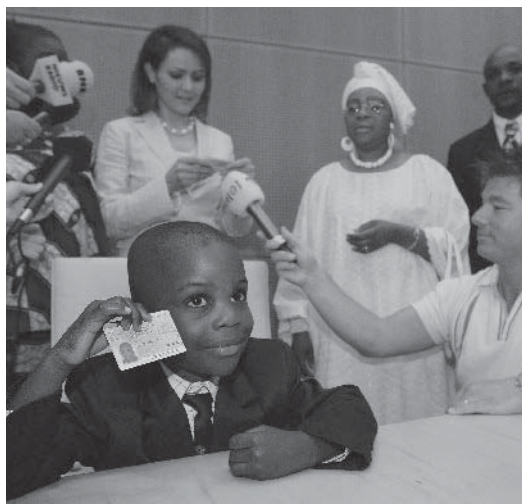
Legaal in Nederland.