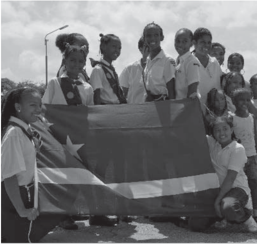
Feest bij de zelfstandigheid van de Antillen op 10-10-2010.