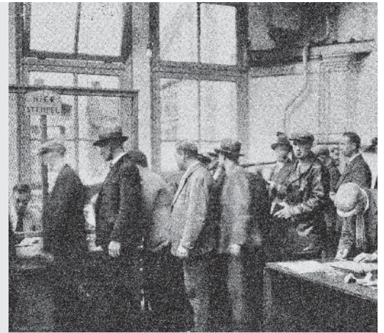
Lange rijen werklozen voor het stempellokaal (foto uit 1933).

stempel halen bij het stempelkantoor. Om te voorkomen dat de werklozen stiekem gingen werken, was het stempelkantoor iedere dag op een andere tijd open. Ondertussen bedacht de regering projecten waar veel werklozen aan konden werken, zoals de aanleg van de Afsluitdijk en het Kralingse Bos in Rotterdam. De crisistijd duurde tot aan de Tweede Wereldoorlog.