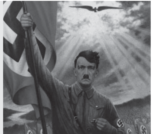
Hitler op een poster van de nazi's uit 1938.

Met zijn aanhangers, de nazi's , verspreidde Hitler via posters, kranten, radio en films zijn ideeën over de grootheid van het Duitse volk. Door deze propaganda werden veel Duitsers erg nationalistisch en kregen ze een hekel aan buitenlanders en joden. Ondertussen bereidde Hitler het Duitse volk voor op een nieuwe oorlog. In 1939 was het zover: Hitler viel Polen binnen en de Tweede Wereldoorlog brak uit.