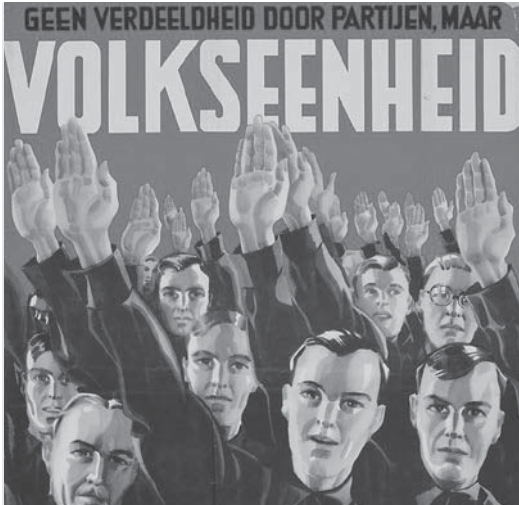
Anti-democratische NSB-poster (1935).