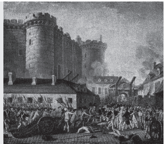
De bestorming van de Bastille op 14 juli 1789.

opstandelingen. Nu hadden ze wapens. De opstandelingen bestormden de Bastille, een fort waar kruit opgeslagen lag. Dit vormde het begin van de revolutie : de opstand verspreidde zich daarna over heel Frankrijk. De haat tegen de edellieden en de geestelijken was groot. Het volk trok naar de kloosters en kastelen met schoppen en hooivorken. Ze vermoordden de inwoners en staken de gebouwen in brand