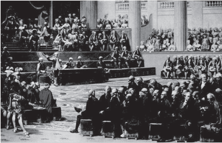
Koning Lodewijk XVI roept de vergadering van de standen bijeen in 1789.