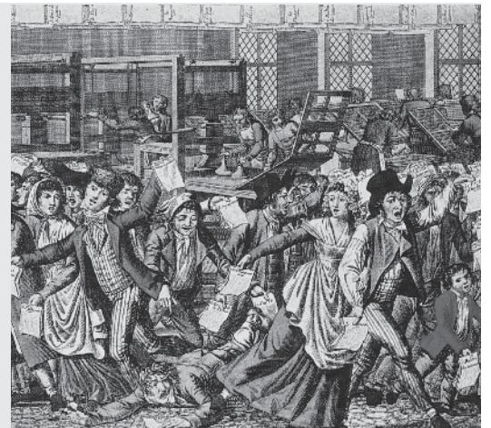
Boze burgers gaan de straat op en verspreiden nieuwe ideeën over gelijkheid.

De koning snapte niets van de onvrede. Hij liet toch rijst en graan uitdelen? Mensen beweerden dat koningin Marie-Antoinette zei: 'Als ze geen brood hebben, eten ze maar cake.' Hoewel dat niet waar was, maakte zo'n verhaal het volk boos. Zulke verhalen verspreidden zich snel dankzij de drukpers. Nieuwe ideeën over gelijkheid en democratie werden in grote aantallen gedrukt. Iedereen kon ze nu lezen.