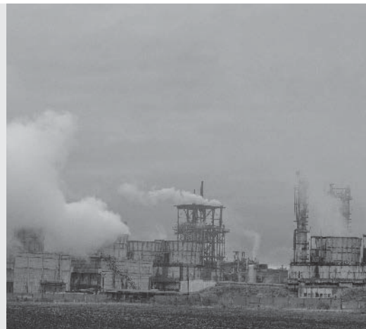
Vervuilde lucht trekt zich niets aan van landsgrenzen.

hebben. Via de lucht, de zee of een rivier komen giftige stoffen gemakkelijk in buurlanden terecht. De Europese Unie wil iets aan die milieuvervuiling doen. Wie bij de Unie wil horen, moet zich aan strenge milieuregels houden. In Roemenië was de industrie altijd erg vervuilend. Sinds Roemenië bij de Europese Unie hoort, moet het zich ook aan die milieuregels houden. De Europese Unie geeft geld om Roemenië daarbij te helpen.