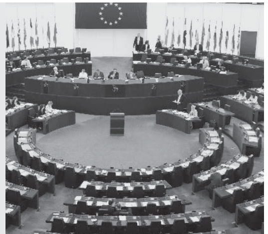
In het Europees Parlement zitten meer dan 750 mensen.

zich aan moet houden. De Europese Unie, afgekort EU, heeft ook een regering, de Europese Commissie . Daarin zit één man of vrouw uit ieder land van de Europese Unie. Elke wet die zij maken, moet worden goedgekeurd door het Europees Parlement . Daarin zitten 751 mensen uit alle landen van de Europese Unie. Om de vijf jaar mogen de inwoners van de EU kiezen wie er in dat parlement komen.