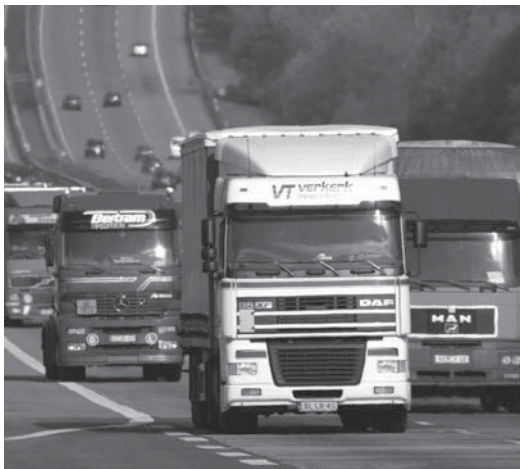
Het vrij verkeer van goederen heeft veel voordelen voor de handel.